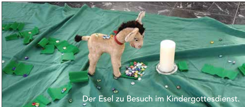
Der Esel zu Besuch im Kindergottesdienst.